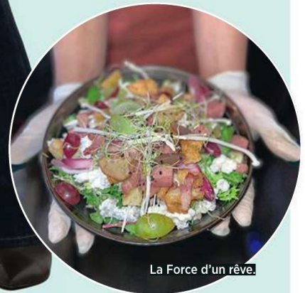
La Force d'un rêve.

LA FORCE D'UN RÊVE, 47, GRAND-PLACE, 7600 PÉRUWELZ. FACEBOOK.COM/LAFORCEDUNREVEPERUWELZ.